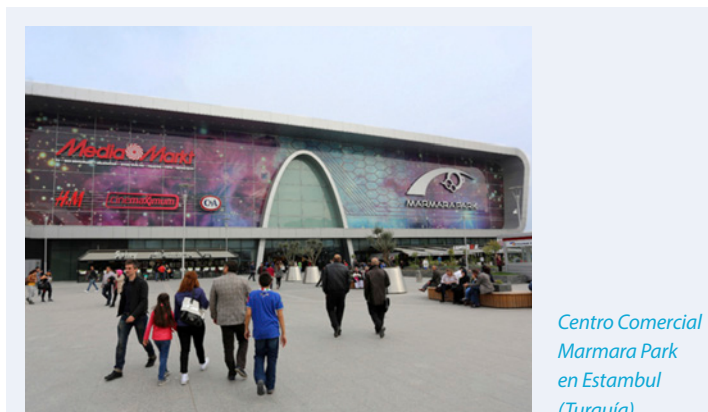
Centro Comercial Marmara Park en Estambul (Turquía)

ECE actúa como un único proveedor de servicios y ofrece todos aquellos servicios relacionados con inmuebles de una forma completa, creando de esta forma más valor añadido para los clientes. Con un enfoque a largo plazo ECE también trabaja con ciudades y apoya a los municipios para desarrollar de manera sostenible los centros de las ciudades y el comercio al por menor local.