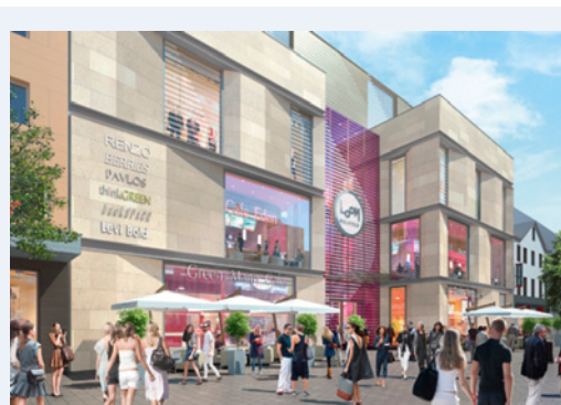
En construcción: Galería Comercial Loom en Bielefeld (Alemania)

La sostenibilidad juega un papel importante en ECE. Se integra continuamente en el trabajo diario. Existen estructuras e instrumentos de sostenibilidad implementadas como el “Nachhaltigkeitsbeirat” o las certificaciones del “Deutschen Gesellschaft für Nachhaltiges Bauen (DGNB)” que apoyan la realización y el desarrollo de nuestra estrategia de sostenibilidad.