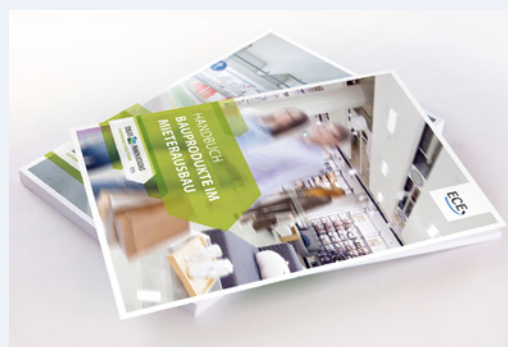
La sostenibilidad juega un papel importante en el trabajo diario