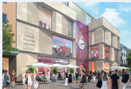
W trakcie budowy: Galeria handlowa Loom w Bielefeld (Niemcy)

Rozwój zrównoważony w firmie ECE odgrywa znaczącą rolę i jest systematycznie wdrażany w codzienny tryb pracy. Implementowane struktury i instrumenty rozwoju zrównoważonego, takie jak Rada ds. Zrównoważonego Rozwoju lub certyfikacje Niemieckiego Certyfikatu Budownictwa Zrównoważonego (DGNB), wspierają realizację i rozwój naszej obszernej strategii zrównoważonego rozwoju.