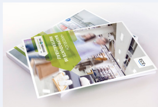
Zrównoważony rozwój odgrywa ważną rolę w codziennej pracy