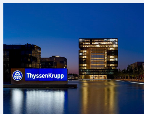
Siedziba główna firmy ThyssenKrupp w Essen (Niemcy)