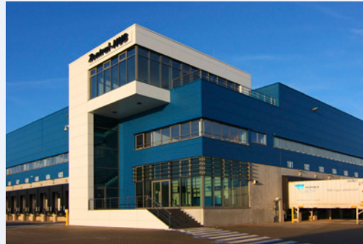
Hermes Zentral- HUB in Hessen (Deutschland)