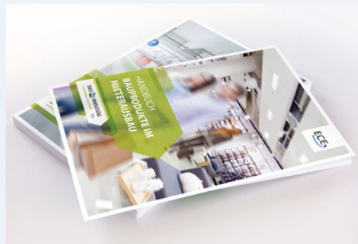
Nachhaltigkeit spielt bei der täglichen Arbeit eine große Rolle