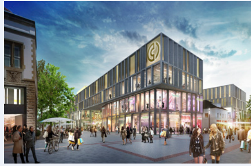
In Planung: das Center Cano in Singen (Deutschland)

Nachhaltigkeit spielt bei der ECE eine große Rolle. Sie wird kontinuierlich in die tägliche Arbeit integriert. Fest implementierte Nachhaltigkeitsstrukturen und -instrumente wie der Nachhaltigkeitsbeirat oder die Zertifizierungen der Deutschen Gesellschaft für Nachhaltiges Bauen (DGNB) unterstützen die Umsetzung und Weiterentwicklung unserer umfassenden Nachhaltigkeitsstrategie.