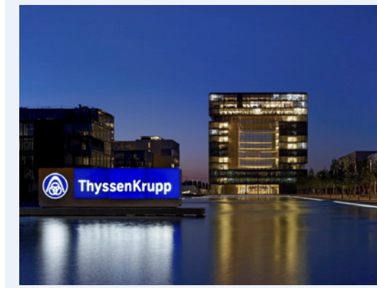
ThyssenKrupp Genel Merkezi – Essen (Almanya)