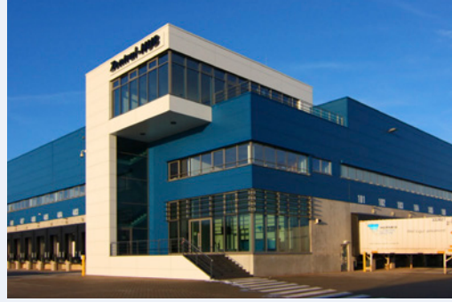
Hermes Dağıtım Merkezi – Hesse (Almanya)