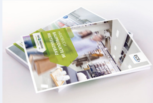
Sürdürülebilirlik günlük iş akışında önemli bir rol oynamaktadır