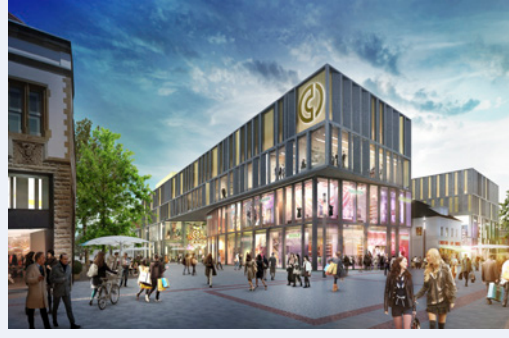
Planlama aşamasında: Singen'deki Center Cano (Almanya)

Sürdürülebilirlik ECE'de büyük bir rol oynamakta ve sürekli olarak günlük çalışma hayatına entegre edilmektedir. Sürdürülebilirlik Danışma Kurulu veya Alman Sürdürülebilir Yapılar Derneği'nin (DGNB) sertifikasyonları gibi kararlı bir şekilde hayata geçirilen sürdürülebilirlik yapıları ve araçları, geniş kapsamlı sürdürülebilirlik stratejimizin uygulanması ve geliştirilmesi konusunda bizlere destek olmaktadır.